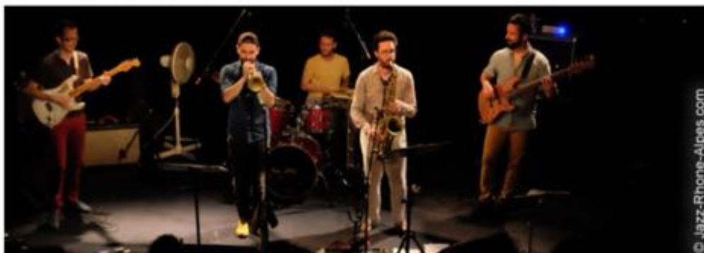
Soirée très groove décidément avec le lancement du premier album du groupe "Cissy Street" au Périscope.